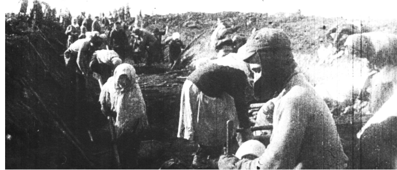
Работы на строительстве оборонительных укреплений у г. Орджоникидзе. 1942 г.