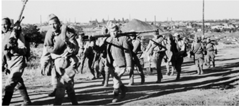
Подразделение пехотинцев на окраине г. Орджоникидзе. 1943 г.

В суровые дни войны Кадгарон потерял 523 воина из 1000 ушедших на войну. Среди павших 12 учителей и 130 учащихся. Память бережно хранит подвиги пяти братьев Каллаговых —